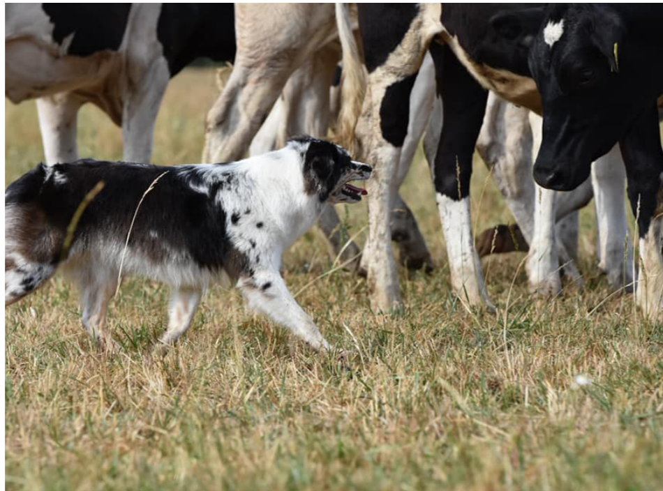
Stjernborgens Maya gör vallhundsprov på nöt.

och rankingpoäng till bland annat Unghundscupen. Hunden kan även ta meriten 1-pris, 2-pris och 3-pris.