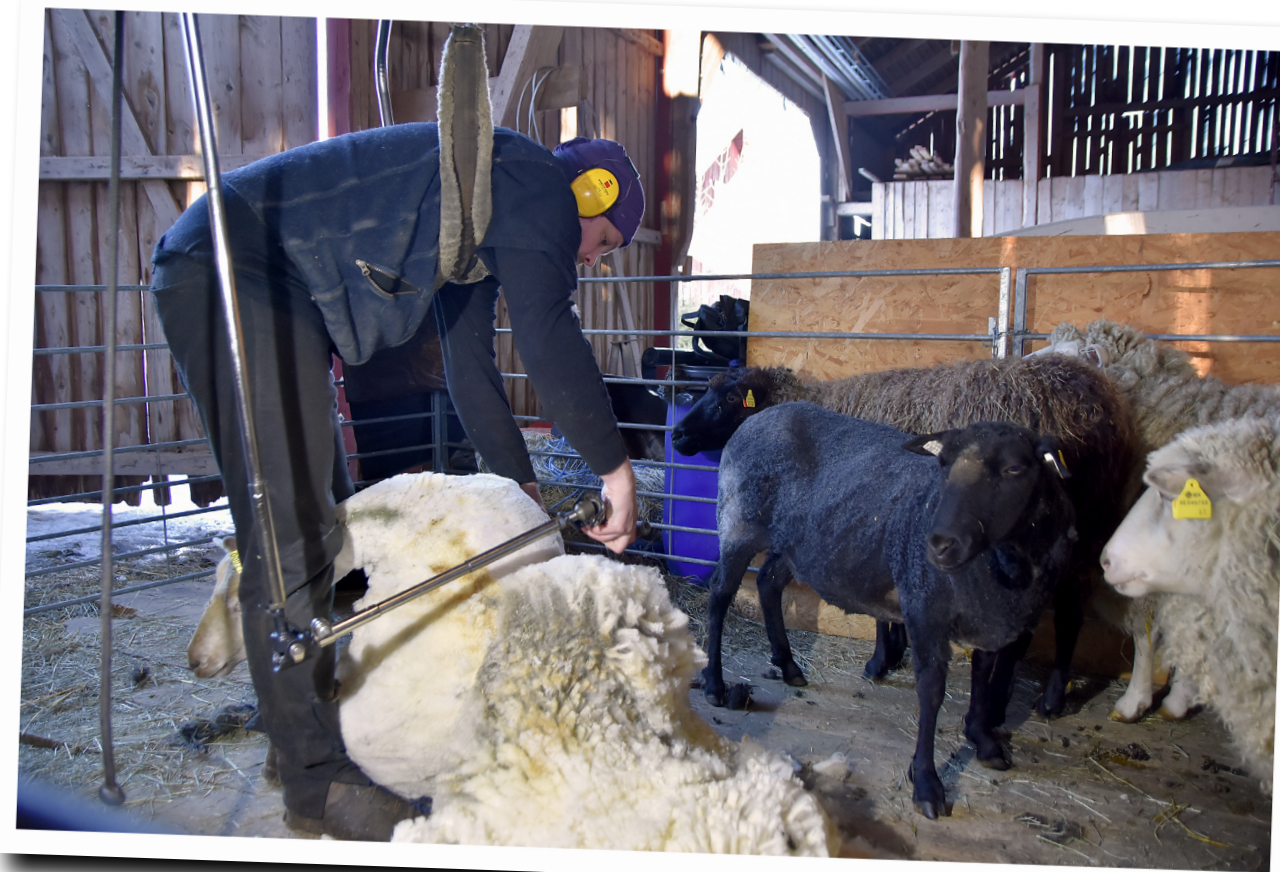
Det gör ingenting om de klippta fåren blandar sig med de oklippta, det kan tvärtom vara bra då får lätt blir stressade av att vara ensamma.

ett fast underlag. En yta på 2.5 x 2.5 meter räcker bra för själva klippningen samt en takhöjd på 2.5 m för montering av klippmaskinen, glöm ej att dra fram jordad el. Underlaget ska vara strävt så inte djuret glider från klipparen, den ruggade sidan på en masonitskiva fungerar utmärkt. Om klippningen sker på ströbädd eller lutande ytor måste denna förstärkas med en stadigare skiva under masoniten och eventuellt vägas upp.